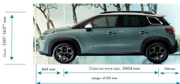
Volumen de maletero: 410 litros. Extensible hasta 520 litros * Altura con barras de techo ** Retrovisores abatidos